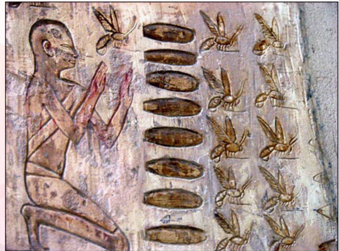
(Hieróglifos do antigo Egito já demonstram a relação do homem com as abelhas)

Em sua composição há vitaminas do complexo B, C, H e O, além de flavonóides, galangina, resinas com bálsamo, cera e pólen, o que confere à própolis todos os seus poderes terapêuticos.